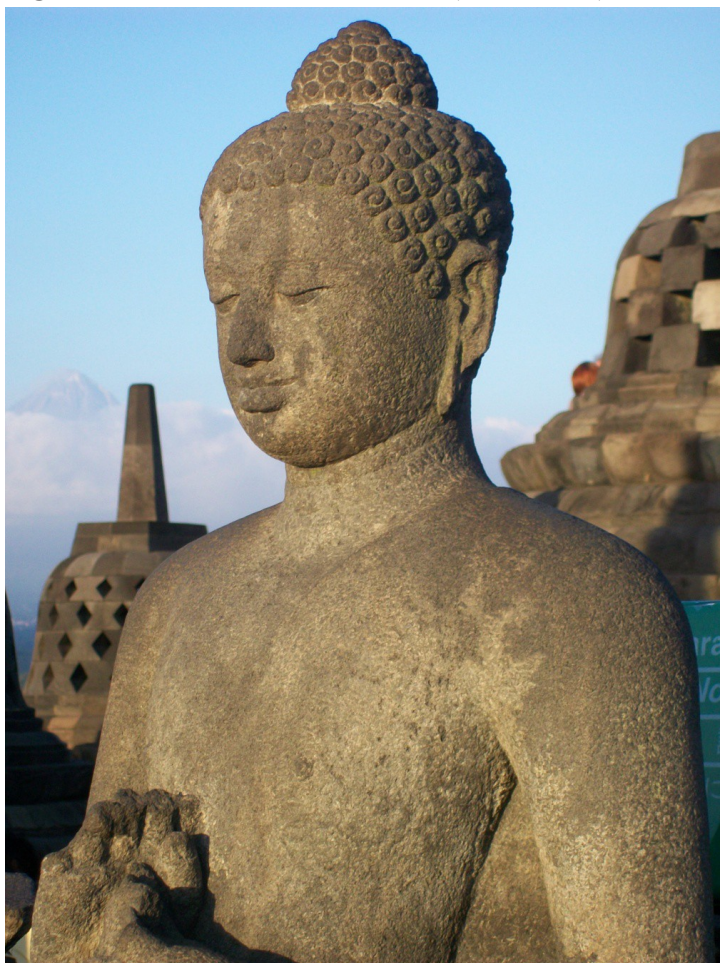
Figure 4a. Un bouddha en andésite (Borobudur)

L'activité extractive n'est pas récente : les prang hindouistes de Prambanan au sud du volcan et le vaste stupa bouddhiste de Borobudur à l'ouest ont été bâtis aux VIII e et IX e siècles à partir de blocs de lave (figure 4a) récupérés dans les vallées (figure 4b). Depuis des siècles, les carrières ont fait partie du quotidien des habitants du volcan, et représentent une ressource qui leur a permis de vivre avec les crises volcaniques.