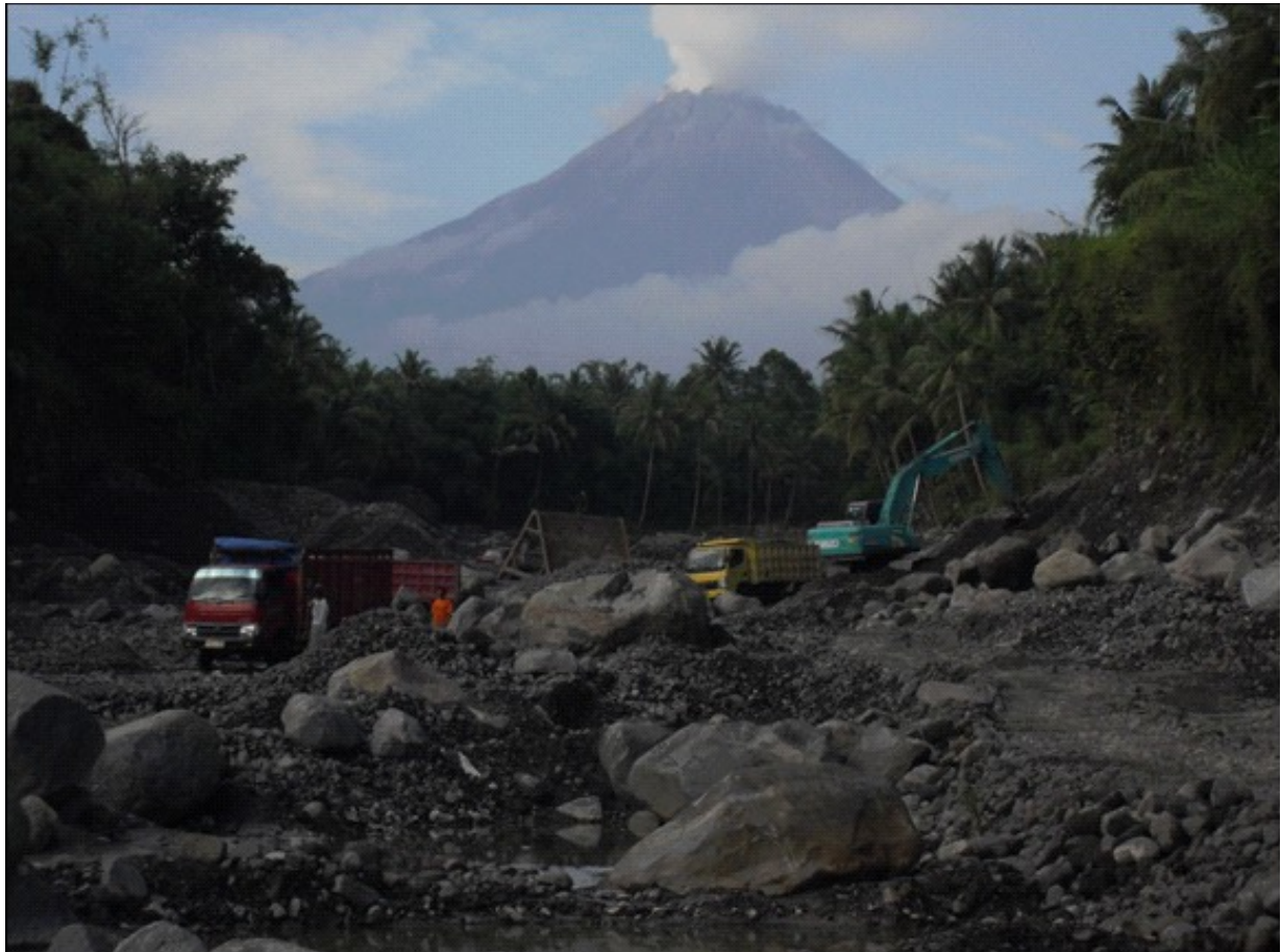
Figure 1. Une carrière à l'ouest du volcan Merapi

Les travailleurs s'exposent aux coulées de boue qui apportent le matériel volcanique loin en aval. Ce danger est accepté car l'activité extractive apporte beaucoup et a longtemps fait partie de l'adaptation des communautés locales au volcanisme... mais les évolutions récentes de l'activité commencent à en montrer les limites.