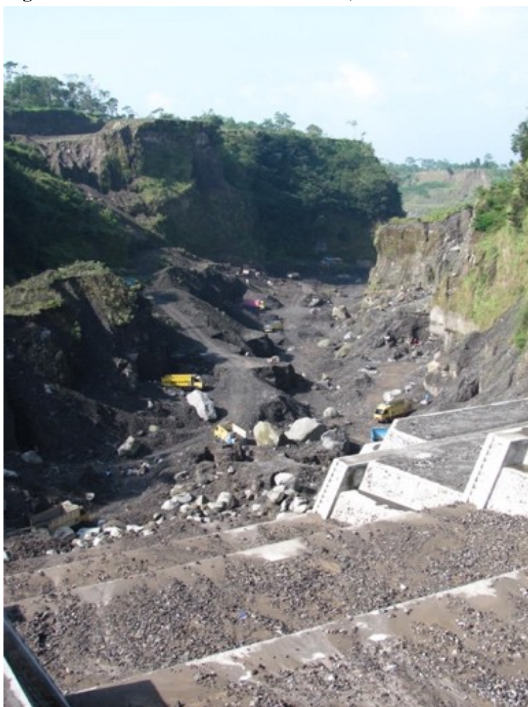
Figure 4b. Carrière dans la vallée Woro, au sud-est du volcan, au pied d'un barrage (2010)

Les dépôts exploités ont une inégale granulométrie.