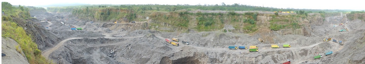
Figure 3. Panorama de la vallée Gendol

aux agriculteurs contraints d'abandonner leurs rizières, leurs champs et leurs troupeaux de toucher un revenu de remplacement. Cette opération a l'avantage de transformer les aléas volcaniques en pourvoyeurs de ressources. Les extractions permettent aussi d'accélérer le curage des rivières, ce qui limite les risques de coulées du matériel instable tout en redonnant à la vallée sa forme initiale en quelques années seulement. Une fois les matériaux évacués, il arrive même que le fond de vallée soit cultivé. Les flancs du volcan sont alors prêts pour la prochaine éruption. En ce sens, l'activité d'extraction est le pilier de la forte résilience des populations du Merapi, mais aussi de leur environnement.