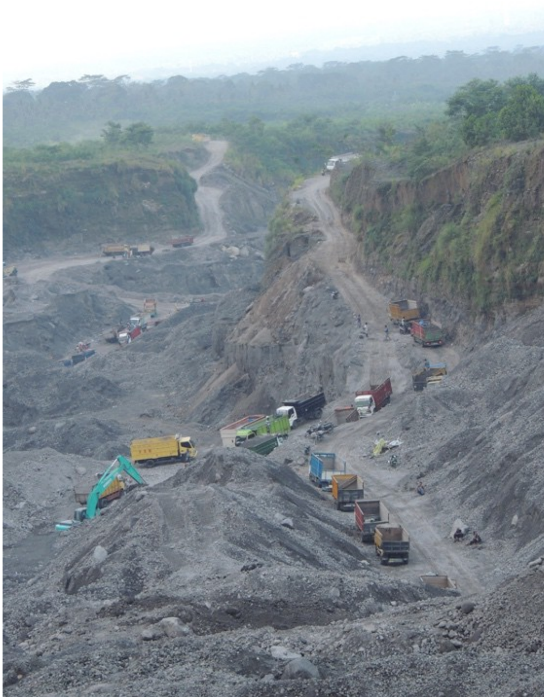
Figure 8. Saturation du trafic dans la vallée Gendol

L'irrégularité du fond de vallée rend difficile la circulation.