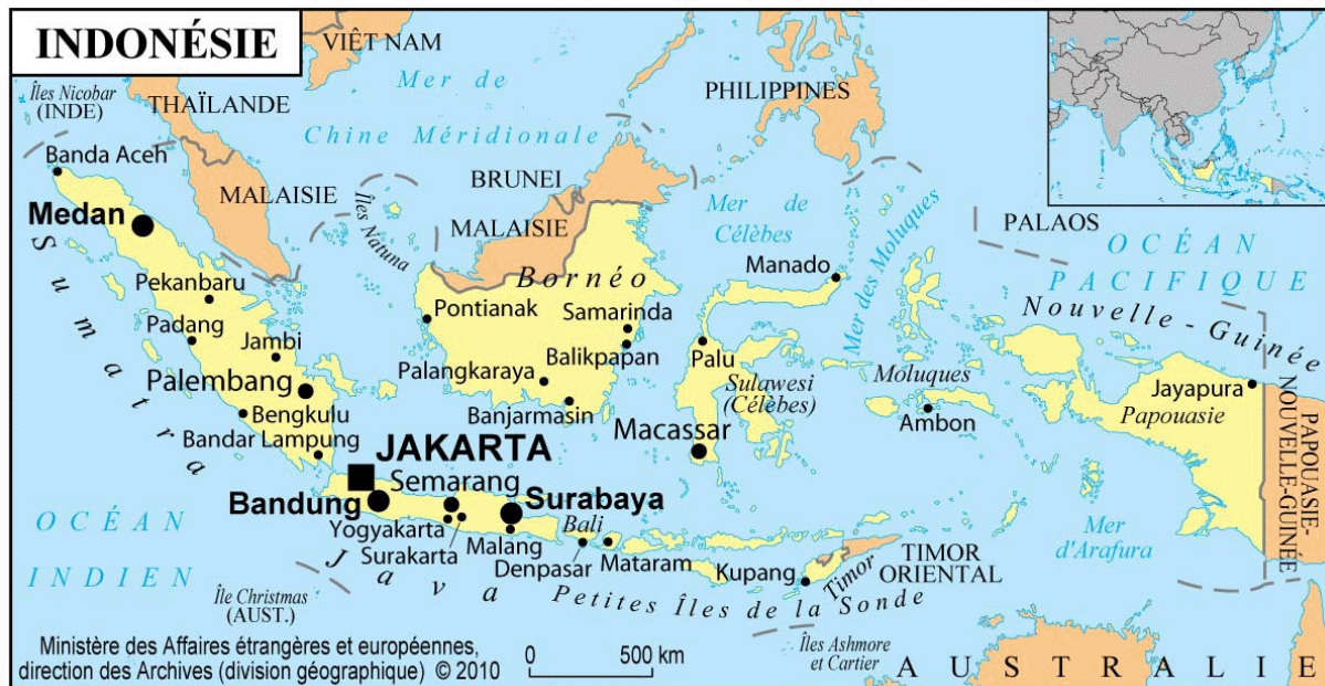
Figure 2. Carte de localisation

Le seul risque important est celui de la destruction provoquée par les éruptions très fréquentes du volcan, caractérisées notamment par des coulées pyroclastiques 2 (Gertisser et al. 2012), suivies par des écoulements boueux très concentrés entraînés le long des rivières par les pluies de mousson que l’on appelle des lahars (Lavigne et al. 2000). Ces derniers s’étendent plus loin que les coulées pyroclastiques, et peuvent se produire pendant plusieurs années après une éruption.