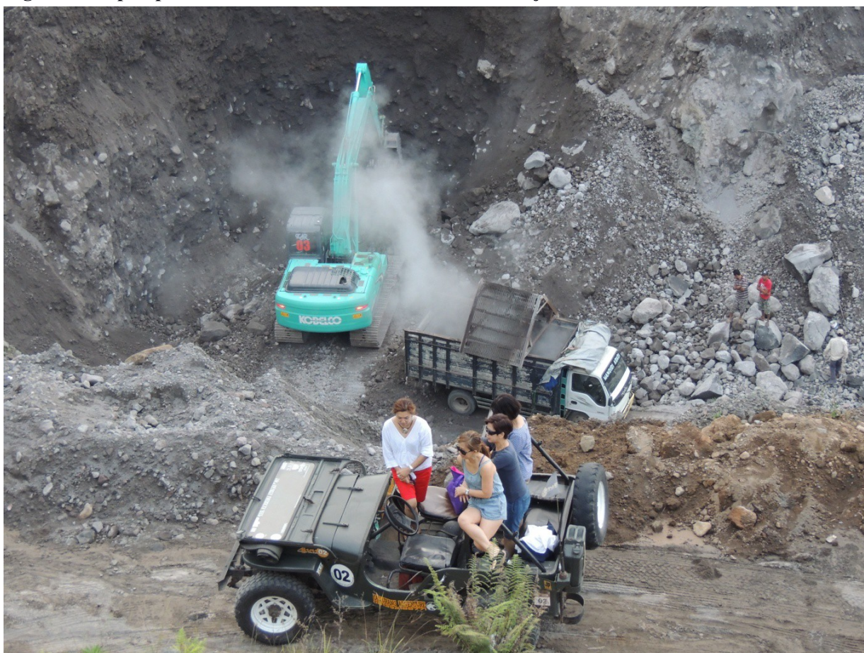
Figure 6. Jeep et pelleteuse dans la Gendol : de nouveaux enjeux dans les carrières

L'irruption d'acteurs externes représente l'un des principaux points d'achoppement de cette évolution récente de l'activité. Les techniciens chargés de faire fonctionner les pelleteuses sont salariés par l'entreprise, et se déplacent d'un chantier à l'autre. Ils habitent pour quelques semaines dans les villages riverains de la Gendol, à Kepuharjo notamment, où ils s'intègrent peu, restant le plus souvent entre eux. D'autres acteurs externes investissent les carrières de la Gendol depuis quelques années : les touristes, indonésiens ou étrangers, visitent en jeep les flancs du volcan. Les jeunes des villages détruits lors de l'éruption de 2010 se sont très tôt tournés vers l'option touristique. Des parcours de motocross, puis des visites en jeep (figure 6) ont été développés et intègrent des passages dans le fond des vallées. Les carrières de la Gendol accueillent ainsi plusieurs dizaines de touristes par jour, dont les jeeps viennent se mélanger aux nombreux camions et aux pelleteuses (200 camions par heure).